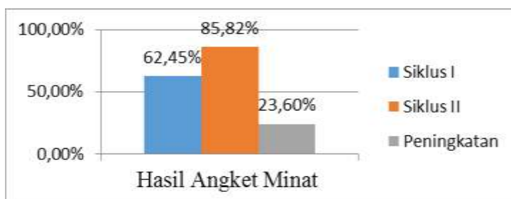
Gambar Grafik Kenaikan Angket Minat Siswa Siklus I Ke II

Dari tabel diatas maka diagram grafik data tersebut dapat dilihat pada gambar dibawah ini.