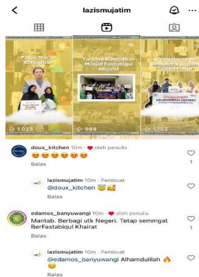
Gambar 5. View dan Komen Instagram

Pengoptimalisasian media sosial yang dimiliki oleh Lazismu Jatim dapat menjadi penunjang peningkatan eksistensi lembaga karena dengan adanya media sosial yang dimanfaatkan dengan baik dan mengikuti trend yang ada akan membuat berbagai konten tersebut akan menyebar luas dan dikonsumsi oleh masyarakat luas. Seperti yang terjadi pada lazismu jatim, dengan mengkonsistenkan konten yang dibuat dengan feed yang rapi dapat meningkatkan jumlah viewer dan mengundang banyak orang untuk sekedar mengunjungi profil media sosialnya atau meninggalkan jejak dengan like dan komen postingan yang ada.