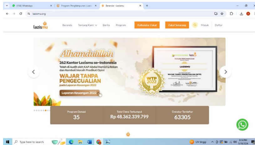
Gambar 3. Sertifikasi Lazismu Jatim