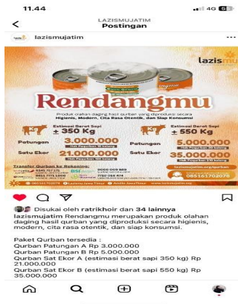
Gambar 6. Media informasi Lazismu

Media sosial menjadi alat penunjang penyebaran informasi melalui konten ataupun pamflet yang disebarluaskan di media sosial. Dengan adanya pamflet atau konten yang menarik tentunya akan membuat seseorang tertarik dan lebih mudah mengakses berbagai informasi yang ada seperti mencari profil lembaga, informasi donasi ataupun akses untuk mengetahui berbagai kegiatan yang dijalankan oleh Lazismu.