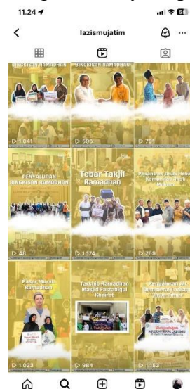
Gambar 4. Profil Instagram Lazismu Jatim dan Konten Media

Media sosial yang ada dapat menunjang program kerja di Lazismu Jatim dengan melakukan pengembangan masyarakat seperti bakti sosial, pemberdayaan UMKM, dan berbagai kegiatan Ramadhan ataupun Idul Adha yang diabadikan di tiktok ataupun Instagram yang dikemas dalam konten yang menarik agar nantinya dapat menarik minat penonton.