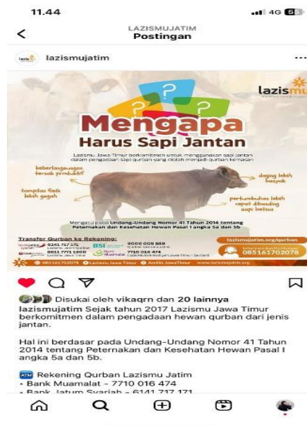
Gambar 7. Postingan feed Instagram Lazismu

Seperti pada gambar 7 dapat dilihat bahwa Lazismu Jatim mengunggah berbagai informasi guna mendukung tentang hal-hal yang berkaitan dengan nilai-nilai keislaman. Hal tersebut dilakukan guna menunjang program kerja yang dijalankan. Lazismu Jatim menggerakkan program kerjanya dengan berlandaskan nilai-nilai keislaman yang tidak menentang nilai keagamaan karena sesuai dengan organisasi masyarakat yang berbalut keislaman. Edukasi yang dilampirkan di feed dapat berupa informasi terkait qurban seperti “mengapa harus sapi jantan?”. Edukasi yang diterbitkan pun menyesuaikan sesuai dengan timeline dan event yang akan atau sudah dijalankan.