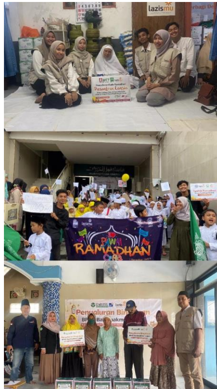
Gambar 2. Program Lazismu Jatim