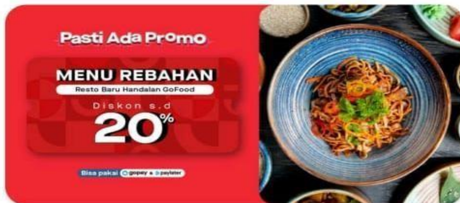
Gambar 5.2 promo yang di sediakan Go Food