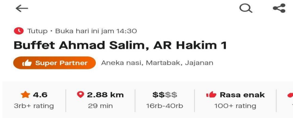
Gambar 1 Layanan Go food Buffet Ahmad Salim