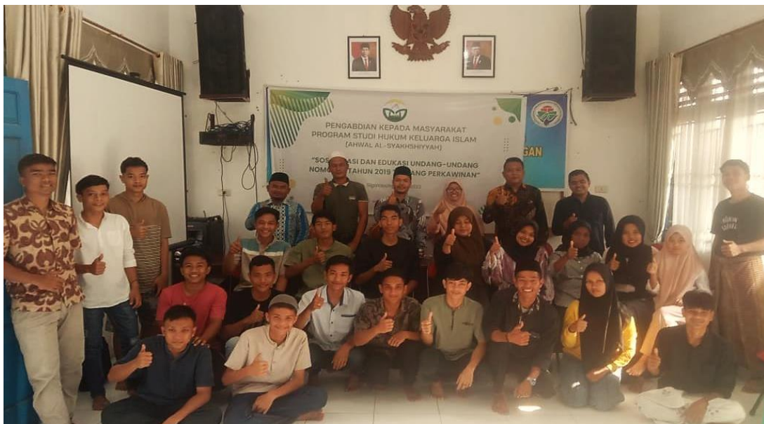
Gambar .5. Sosialisasi dan Edukasi UU No. 16 Tahun 2019...

Berdasarkan total hasil jawaban hasil pretest dan posttest pada gambar 9, dapat dilihat terdapat kenaikan tingkat pemahaman peserta. Pada pretest , peserta yang menjawab pertanyaan dengan benar berjumlah 17 peserta atau 24%, dan sisanya sebanyak 53 peserta atau 76% salah dalam memberikan jawaban. Sedangkan pada posttest , peserta yang menjawab dengan benar berjumlah 67 orang sedangkan yang menjawab salah berjumlah 3 orang dengan kata lain ada peningkatan pemahaman terkait perkawinan dikalangan Naposo Nauli Bulung sebesar 72 % setelah dilakukannya Sosialisasi dan edukasi tentang perkawinan.