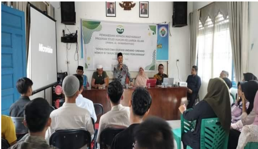
Gambar. 2. Sosialisasi dan Edukasi UU No. 16 Tahun 2019...

masyarakat tentang perkawinan. Sosialisasi adalah metode yang dapat dilakukan untuk menyadarkan sasaran terhadap dampak negative perkawinan dibawah umur.