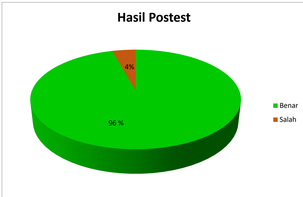
Gambar. 4. Hasil Posttest Sosialisasi dan Edukasi UU No. 16 Tahun 2019...

Berdasarkan total hasil jawaban hasil pretest dan posttest pada gambar 9, dapat dilihat terdapat kenaikan tingkat pemahaman peserta. Pada pretest , peserta yang menjawab pertanyaan dengan benar berjumlah 17 peserta atau 24%, dan sisanya sebanyak 53 peserta atau 76% salah dalam memberikan jawaban. Sedangkan pada posttest , peserta yang menjawab dengan benar berjumlah 67 orang sedangkan yang menjawab salah berjumlah 3 orang dengan kata lain ada peningkatan pemahaman terkait perkawinan dikalangan Naposo Nauli Bulung sebesar 72 % setelah dilakukannya Sosialisasi dan edukasi tentang perkawinan.