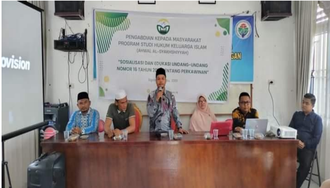
Gambar.1. Sosialisasi dan Edukasi UU No. 16 Tahun 2019 di desa Sigalapang

Naposo Nauli Bulung terdiri dari dua kata, yaitu Naposo dan Bulung , dimana Naposo artinya muda, baik anak laki-laki yang masih muda atau belum pernah berumah tangga, begitu juga anak perempuan, gadis yang belum pernah berumah tangga dan masih berada dalam pengawasan orang tua, hatobangon , harajaon di dalam satu desa. Bulung artinya daun, lambang kehidupan yang berkembang, mereka masih hijau daun yang menunggu saat menjadi daun yang tua, dengan arti menunggu saat untuk berumah tangga. 4 Dari pengertian tersebut, dapat disimpulkan bahwa naposo nauli bulung ini sama halnya dengan remaja. Menurut Agus Dariyo dalam bukunya psikologi perkembangan remaja menyatakan bahwa remaja adalah masa transisi atau peralihan kanak-kanak menuju masa dewasa yang ditandai dengan adanya perubahan aspek fisik, psikis dan psikososial. Secara kronologis yang tergolong remaja ini berkisar antara usia 12/13 – 21 tahun. 5