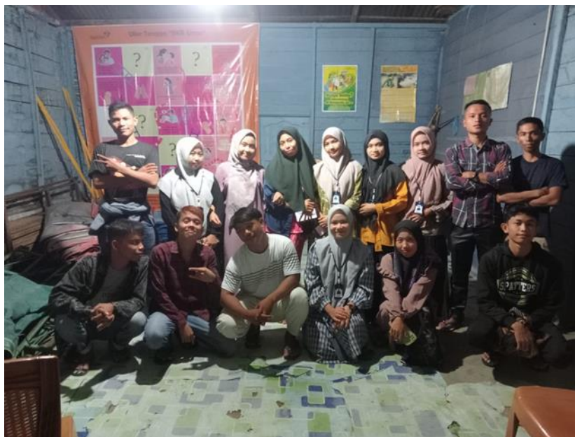
Gambar 1. Kegiatan penyuluhan media sosial aplikasi tiktok

Kegiatan Penyuluhan pemanfaatan Media Sosial Tiktok di Desa Tangga-tangga Hambeng mendapat respon Positif dari kalangan Remaja setempat, pemaparan materi tidak hanya penggunaan Tiktok sebagai media social melainkan dapat memberikan mafaat dalam membangun Entrepreneurship atau Jiwa Berwirausaha dikalangan Remaja dengan memanfaatkan Fitur yang terdapat dalam Tiktok yaitu Tiktok Shop.