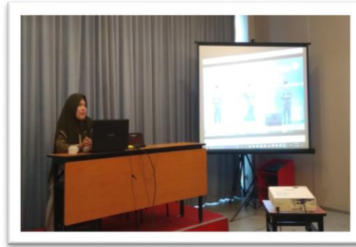
Gambar 10. Diskusi gaya mimik dari Video

Keserasian ialah keindahan tim, mulai dari kekompakan gerak, ekspresi, serta pakaian peserta sebagai satu tim. Pakaian harus sopan, dan tidak memakai asesoris berlebihan. Pakaian pensyarah, penerjemah, dan qori/ah harus sama warna dan modelnya seperti pada (Gambar 11). Gerakan ketiganya harus seirama, mimik wajah dan ekspresinya juga harus serasi (Gambar 12).