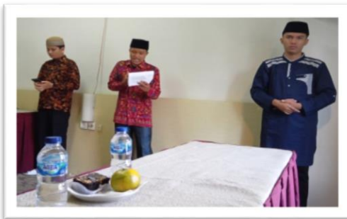
Gambar 5. Latihan Baca Teks berintonasi

Setoran 100% teks diminta pada pembinaan tahap berikutnya, biasanya berjarak 1 minggu dari pembinaan pertama. Pemsyarah sudah tidak dibenarkan melihat teks. Tim tampil utuh menyampaikan teks dari awal sampai akhir dan waktu tampil maksimal 20 menit. Tahap ini adalah pemantapan hafalan, baik hafalan materi, terjemah, dan ayat. Namun, pelatih sudah mulai masuk ke pembinaan ranah retorika dan penghayatan, sebab pembinaan materi dan retorika tidak bisa dipisahkan. Jika teks 1 sudah dikuasai dengan retorikanya, dilanjutkan ke teks kedua, ketiga, dan keempat.