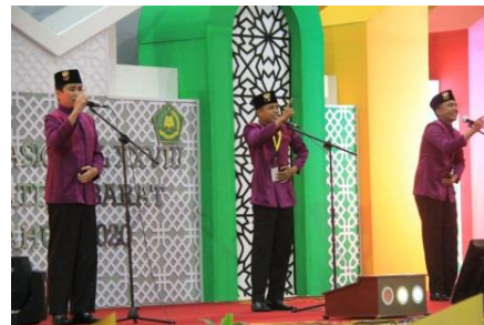
Gambar 12. Serasi dalam gaya dan mimik