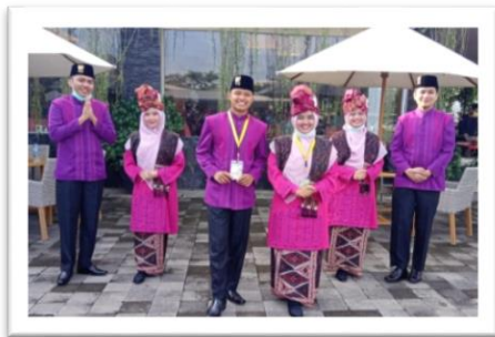
Gambar 11. Keserasian seragam

Keserasian ialah keindahan tim, mulai dari kekompakan gerak, ekspresi, serta pakaian peserta sebagai satu tim. Pakaian harus sopan, dan tidak memakai asesoris berlebihan. Pakaian pensyarah, penerjemah, dan qori/ah harus sama warna dan modelnya seperti pada (Gambar 11). Gerakan ketiganya harus seirama, mimik wajah dan ekspresinya juga harus serasi (Gambar 12).