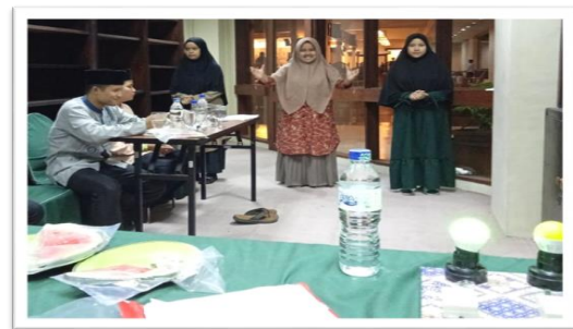
Gambar 6. Latihan Tanpa Teks