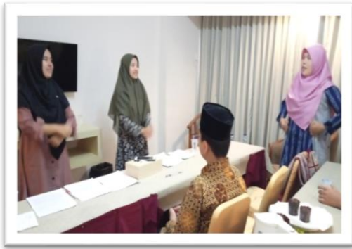
Gambar 9. Pelatih Mencontohkan Gaya dan mimik