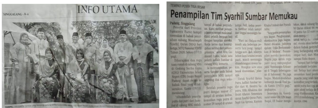
Gambar 7. Liputan media tentang penampilan MSQ Sumbar

dan aksentuasi, serta keserasian dan kekompakan tim. Unsur-unsur tersebut harus dilatih secara terus-menerus, karena retorika dan penghayatan tidak datang begitu saja, melainkan melalui latihan keras dan kesungguhan tim. Peserta cabang Syarhil Qur'an kafilah provinsi Sumatera Barat berhasil tampil memukau penonton dan dewan hakim di saat penyisihan MTQ Nasional XXVIII tahun 2020. Selain unggul di bidang materi, MSQ Sumatera Barat juga unggul di bidang retorika dan penghayatan. Grup MSQ Sumatera Barat tampak menonjol dari tim lainnya, sehingga penampilannya menyentuh hati dewan hakim dan penonton, seperti gambar 7.