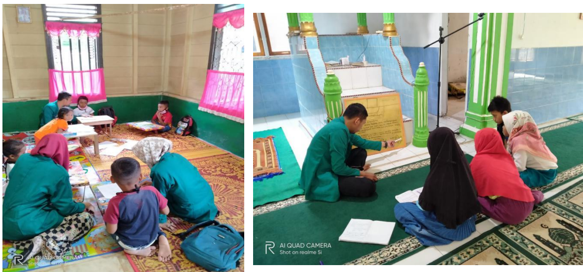
Gambar 1. Proses Pembelajaran di Rumah Belajar Des Ranto Nalinjang

Pada tahap awal masyarakat cenderung kurang percaya dengan adanya program rumah belajar dikarenakan mengganggu jadwal anak untuk membantu orang tua bertani. Hasil musyawarah dengan Tim rumah Belajar akhirnya mengadakan perkumpulan untuk melakukan sosialisai program secara langsung kepada masyarakat yang di bantu oleh aparatur pemerintahan setempat. Sebagian kecil yang menolak program berorientasi bahwa waktu bagi pendidikan anak sebatas pada keaktifan untuk membantu orang tua bertani dan orang tua menganggap pembelajaran daring tidak menjadi kewajiban diikuti serta anak dianggap libur. Kondisi demikian sangat wajar mengingat masyrakat daerah suoh masih belum lama memiliki keterbukaan dalam dunia pendidikan.