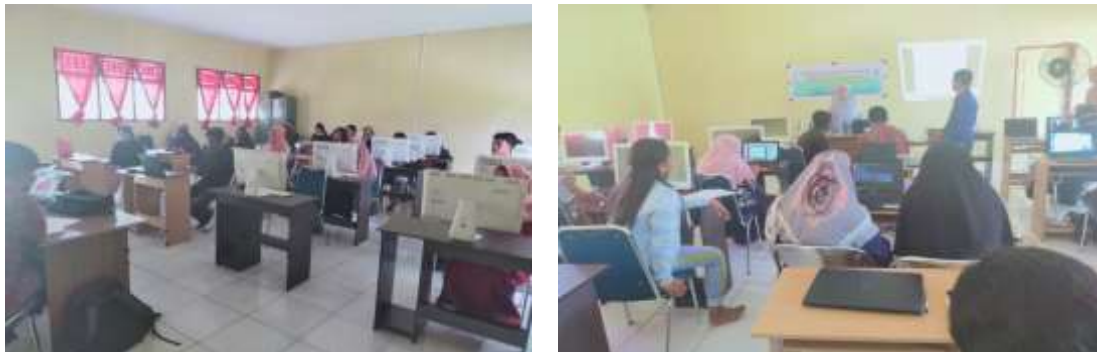
Gambar 2. Proses Pelatihan penerapan aplikasi flip-book berbasis SoM

Pada proses penyampaian materi dan pelatihan, panitia pelatihan membuka sesi diskusi bagi para peserta pelatihan dengan tujuan untuk berikan kesempatan bertanya mengenai materi yang belum dipahami, bertukar pikiran dan gagasan, menyampaikan ide, mengidentifikasi hambatan selama proses pelatihan, mengutarakan kesulitan maupun kendala selama proses pelatihan, dan memberikan solusi terbaik yang dapat diambil untuk mengatasi kendala-kendala yang dialami selama pelatihan. Selama proses pelatihan berlangsung, antusiasme peserta pelatihan terhadap penerapan aplikasi flip-book berbasis SoM dengan system asynchronous sangat tinggi. Hal in idapat dilihat dari sikap aktif para guru dalam mengoperasikan aplikasi tersebut, bahkan pada saat itu para guru segera merancang bahan ajar berbasis digital kemudian diintegrasikan kedalam aplikasi SoM dan mendemonstrasikan pengajaran dengan menggunakan aplikasi tersebut. Selain itu, sikap antusias guru SMK alKhairat Kab Pulau Morotai dapat dilihat dengan banyaknya pertanyaan yang diajukan baik pada saat penyampaian materi maupun pada saat pelatihan. Terihat pula kolaborasi sesame peserta pelatihan dalam membuat tutorial pengajaran selama proses pelatihan berlangsung.