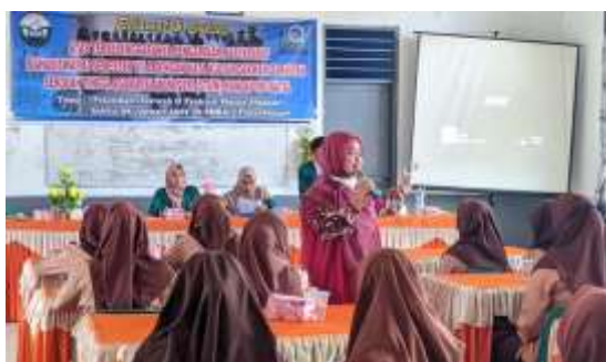
Gambar 2. Pemberian materi tentang dakwah dikalangan remaja di SMKN 3 Panyabungan

Sehubungan dengan pembinaan yang dijelaskan diatas, dalam pengabdian yang dilaksanakan di SMKN 3 Panyabungan merupakan kegiatan pelatihan untuk menumbuhkan pengetahuan, kecintaan para peserta didik kepada dakwah. Regenerasi dakwah diharapkan akan lahir di tengah-tengah lingkungan SMKN 3 Panyabungan dan dimasyarakat lingkungan sekitar. Kegiatan pelatihan peningkatan pemahaman dakwah dikalangan remaja peserta didik-peserta didik SMKN 3 Panyabungan meliputi kegiatan memberikan ceramah, materi tentang pengertian, hukum, unsur, metode, materi dan evaluasi dakwah. Pada bagian ini peserta mendengarkan dan dituntut untuk mampu memahami materi yang dijelaskan pemateri (narasumber). Pada bagian ini juga peserta diberikan peluang untuk bertanya kepada pemateri tentang apa yang belum dimengerti peserta. Selain memberikan materi dan ada sesi Tanya jawab, kegiatan ini juga memberikan contoh dari penampilan pidato dakwah yang langsung dipraktekkan oleh salah satu mahapeserta didik. Ini dilakukan dengan tujuan agar peserta dapat langsung melihat kemampuan orang dalam melakukan dakwah, apalagi pelaku dakwah nya adalah mahapeserta didik yang menjadi panitia dalam kegiatan pengabdian masyarakat.