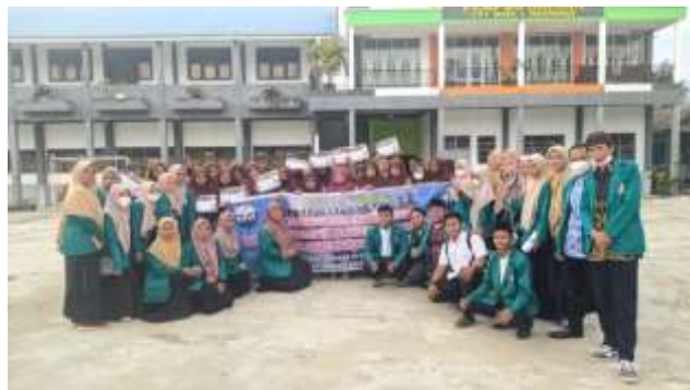
Gambar 6. Foto bersama peserta, panitia dan pemateri kegiatan pengabdian masyarakat.

Akhir dari kegiatan pengabdian masyarakat ini peserta merasa paham dari apa yang dijelaskan pemateri dan mengharapkan ada tindak lanjut dari kegiatan pengabdian ini, agar apa yang telah di ketahui dan dipahami tentang dakwah tidak hilang begitu saja melainkan ada realisasi dari pengetahuan dan keterampilan peserta didik dalam melakukan kegiatan dakwah.