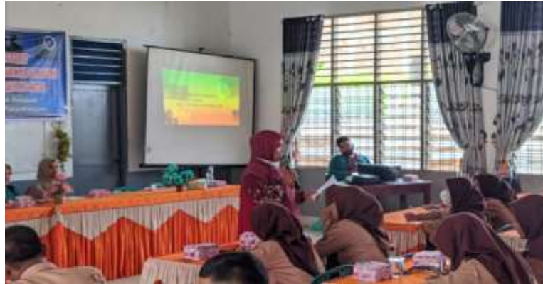
Gambar 5. Pemateri memberikan pertanyaan langsung kepada peserta terkait pemahaman dan motivasi peserta terhadap dakwah di ujung acara.

Akhir dari kegiatan pengabdian masyarakat ini peserta merasa paham dari apa yang dijelaskan pemateri dan mengharapkan ada tindak lanjut dari kegiatan pengabdian ini, agar apa yang telah di ketahui dan dipahami tentang dakwah tidak hilang begitu saja melainkan ada realisasi dari pengetahuan dan keterampilan peserta didik dalam melakukan kegiatan dakwah.