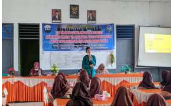
Gambar 3. Penampilan ceramah salah satu mahapeserta didik di depan peserta.

Kegiatan pengabdian selain memberikan materi dan menampilkan kemampuan salah satu mahapeserta didik dalam berceramah, praktek langsung oleh peserta dalam melakukan kegiatan dakwah yang berbentuk ceramah juga ada di kegiatan ini. Peserta yang terbaik dalam mempraktekkan ceramahnya diberikan penghargaan sebagai peserta terbaik dari kegiatan pengabdian masyarakat.