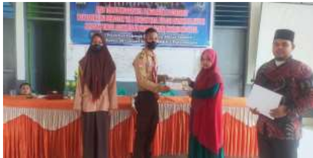
Gambar 4. Pemberian Penghargaan kepada peserta terbaik.

Kegiatan pengabdian selain memberikan materi dan menampilkan kemampuan salah satu mahapeserta didik dalam berceramah, praktek langsung oleh peserta dalam melakukan kegiatan dakwah yang berbentuk ceramah juga ada di kegiatan ini. Peserta yang terbaik dalam mempraktekkan ceramahnya diberikan penghargaan sebagai peserta terbaik dari kegiatan pengabdian masyarakat.