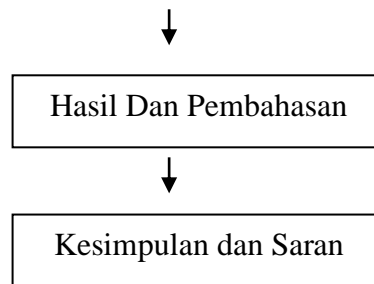
Gambar 1. Bagan Sistematika Penelitian Studi Literatur